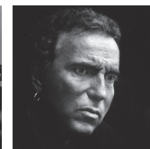
Bernard Lavilliers 1995