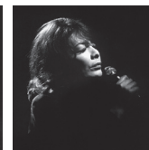
Juliette Gréco 1972