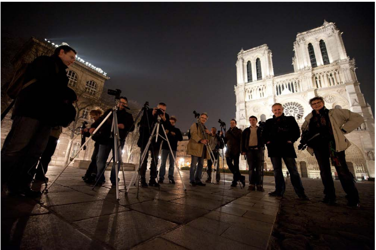
Ile de la cité – Mars 2011

Notre vocation : développer votre créativité photographique, votre regard sur le monde qui vous entoure, créer des images que vous aurez envie de montrer, confronter votre regard photographique à celui d'autres photographes, amateurs, professionnels ou passionnés.