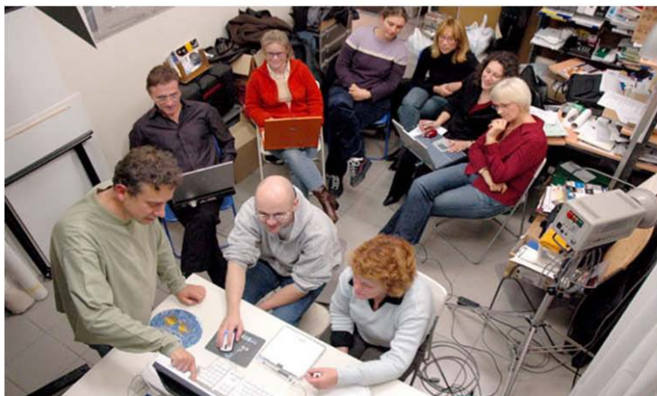
Atelier traitement numérique de l'image.